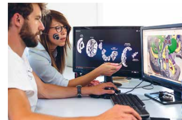
Collaboration au sein d'Agenhor

des synergies qui renforceront leur positionnement sur le marché mondial de l'aérospatiale. Chaque entreprise gagne ainsi en compétitivité à travers ses actions collectives. Dans un secteur très concurrentiel, la coopération entre entreprises peut être cruciale.