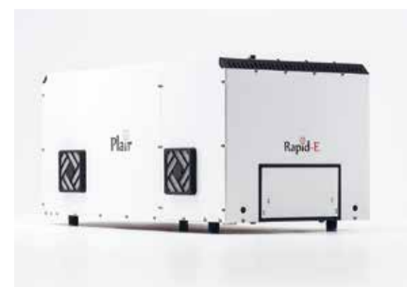
Plair Rapid-E, une machine à surveiller le pollen