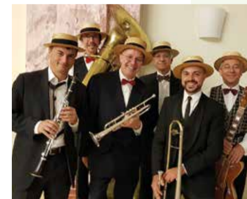
© The Fats Boys Ragtime Band